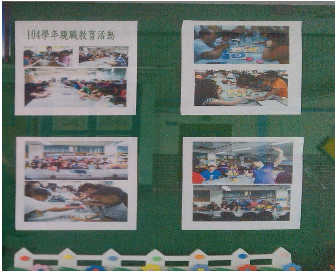
105.4.年兒童節意外的驚喜-義工媽媽現場製作雞蛋糕與學生同樂