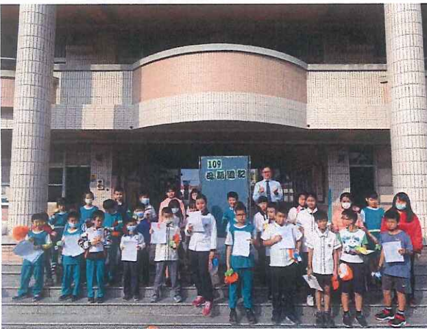
說明：講母語-母語週記優良作品表揚