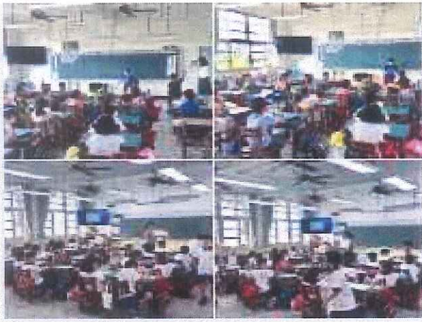
說明：故事媽媽母語說故事。