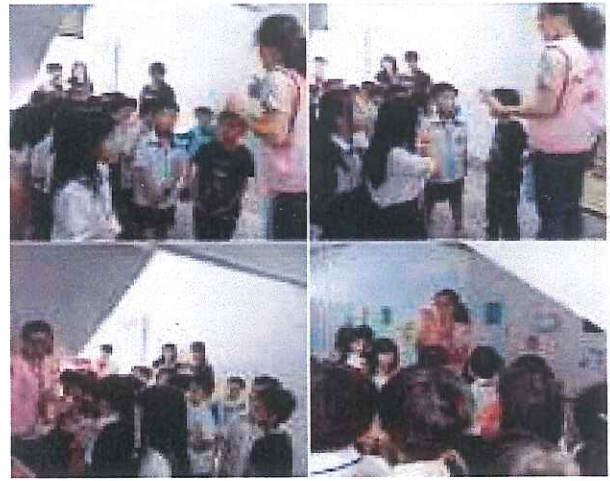
說明：環保義工家長回收宣導融入母語。