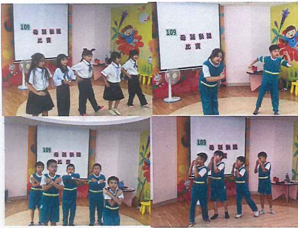
說明：每年舉辦母語歌謠比賽。