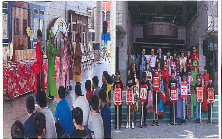
說明：在地課程~白蓮霧嫁女兒小短劇