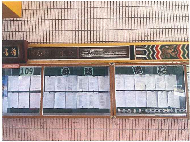
說明：講母語-母語週記作品