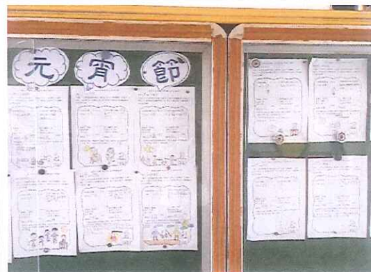
說明：元宵節活動學習單