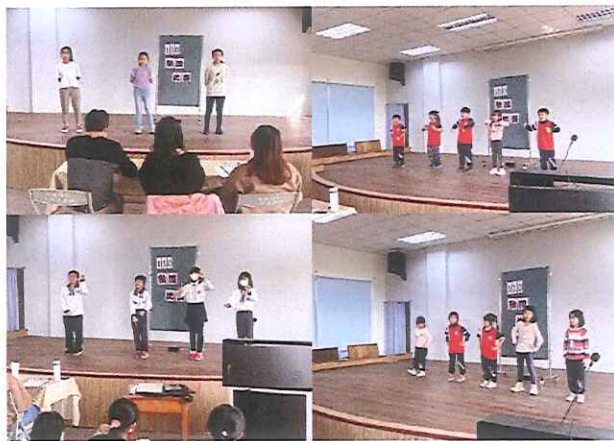
說明：每年舉辦母語歌謠比賽。