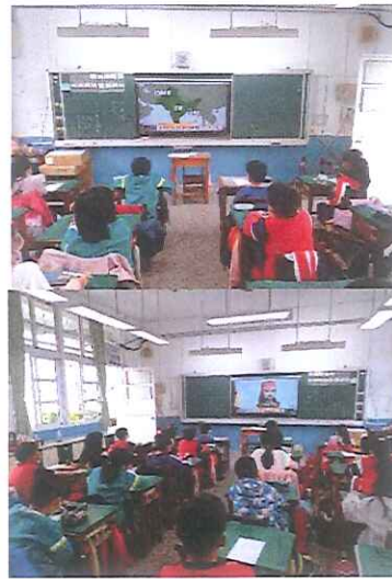
說明：世界母語日宣導