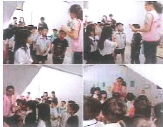
說明：環保義工家長回收宣導融入母語。